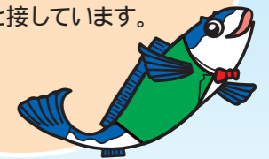
ホッケトットくん

太平洋に面した地方港湾の楸法華港を有し、海向山の北側麓を中心に、南端に位置する活火山「恵山」の北東側麓から銚子岬にかけての海岸線沿いに家屋が連なっており、南西は恵山町と、北は南茅部町と接しています。