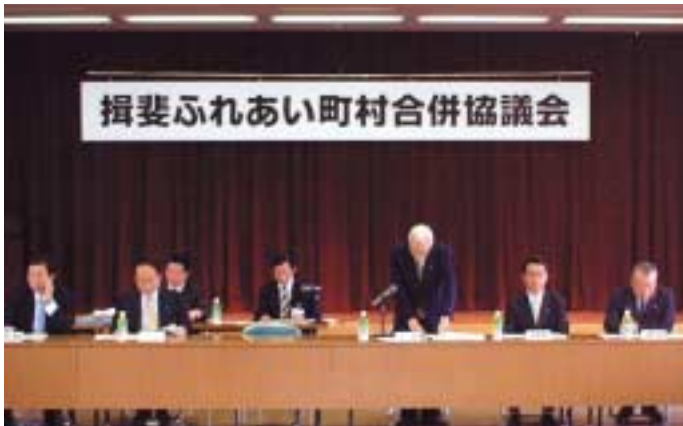
第1回協議会の模様

合併の期日について 期日は平成17年3月までを目標とし、具体的な日時は今後協議会において協議されることになりました。