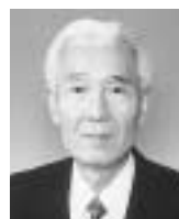
揖斐ふれあい町村合併協議会