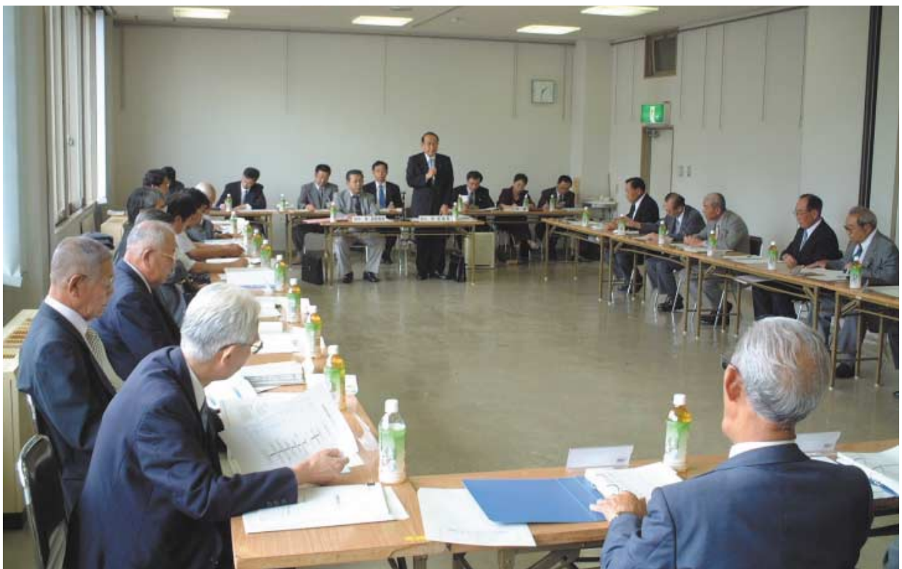
新市建設計画策定小委員会の模様