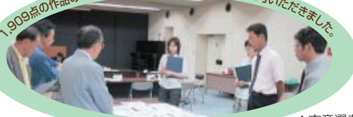
▲市章選考委員会の様子