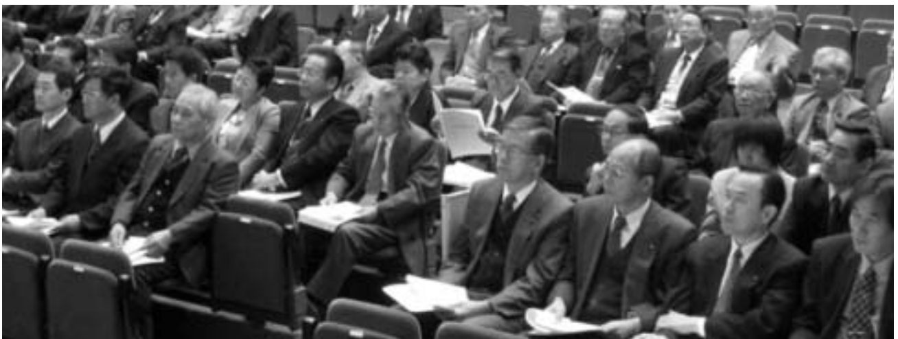
▲調印式に出席した招待者